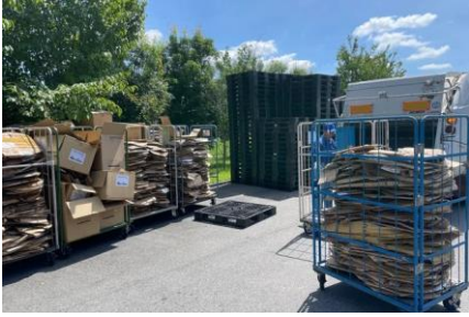
物流センターから排出される段ボール