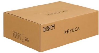
クローズドリサイクル(*2)段ボール

(*1)サーキュラーエコノミー（循環型経済）とは、従来の「使い捨て」型の経済モデルとは異なり、資源を最大限に活用し、廃棄物の発生を最小限化することを目的とした経済モデルです。