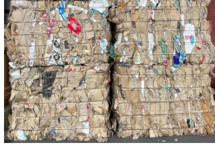
回収された段ボール(一部)