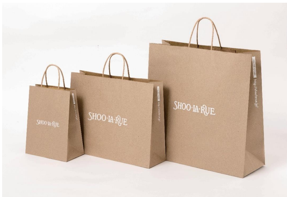
使用済み段ボールのクローズドリサイクル（*2）により生産されたショッピングバッグ。

今回の取り組みは、(株)ワールドの物流センターで排出された使用済み段ボールの一部をリサイクルした古紙100%の再生紙を、ショッピングバッグに使用します。丸紅グループ3社（丸紅フォレストリンクス、丸紅ペーパーリサイクル、興亜工業）は使用済み段ボールの回収から、原料供給、再生紙の生産・供給まで、シモジマはショッピングバッグの製品化を行っています。この取り組みで生まれたショッピングバッグは、2024年3月15日（金）リニューアルオープンのシューラルー 流山おおたかの森S・C店を皮切りに順次全国の店舗にて提供が開始されます。